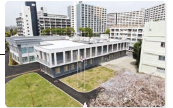
上空から見た校舎