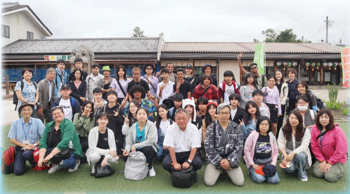
みなかみ 「水上自然教室」川口市立芝西中学校陽春分校 (本文 p.4)