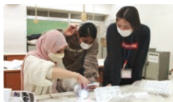
補助の教員も加わっての技術科の授業

数学・英語などの習熟度や日本語の理解度、技能教科での安全性の確保などを考えて少人数授業を行います。