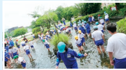
「すあし川」で水遊び