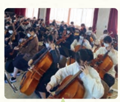
弦楽器の練習風景

授業は長年、歌唱中心で行っていましたが、数年前から楽器をレンタルして弦楽器の授業に挑戦しています。ヴァイオリン・ヴィオラ・チェロを約40台用意し、クラスで弦楽4重奏をするのが目標です。ほとんどの生徒が初心者、しかも3種類もの楽器です。そのうえ私自身も弦楽器が専門ではありません。初回の授業はとても大変です。しかし次第に慣れていき、6週間後には、ある程度形になったアンサンブルができるようになりました。