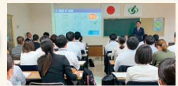
ビジネスマナーを受講する初任者

社会人1年目として最初は大変難しかったが、映像資料や丁寧な説明で自信ができました。(小学校・女性)