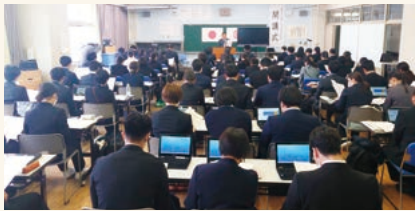
川越市教育センターでの様子

当支部では、埼玉県・さいたま市・川越市・越谷市・川口市の各教育委員会主催の初任者研修会等で、そして今年度か