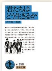
吉野源三郎 著 岩波文庫

私は、「君たちはどう生きるか」を子どもにも大人にも読んでほしいと思います。最近、宮崎 駿監督のジブリ作品のタイトルにも使われました。宮崎 駿監督も感銘を受けたように、私たち大人でも読むと改めて学ぶところがたくさんあります。コペル君の疑問や考え方は、まさに私たちが考えていることであると思います。だからこそ、「おじさん」の言葉は子どもでも大人でもハッとさせられるのでしょう。人との付き合い方やいじめの問題など、「子どもの頃に知っていたらよかったなあ。」と思うこともたくさんあるため、改めて「生き方」について考えさせられます。きっと視野も広がるはずです。