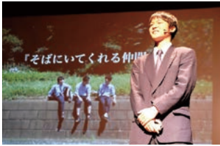
〈映像芸術科〉卒業制作発表会

普段の授業だけでなく、早朝や放課後練習、補習・補講、演奏会、発表会、制作展、公演など、感性や技術を磨く多様な機会に、「多彩な表現」を通して学んでいます。また、芸術を中心とした教科目においては、協働制作、ワークショップ、相互講評などの「主体的・対話的で深い学び(アクティブ・ラーニング)」を通して、表現力を高めています。