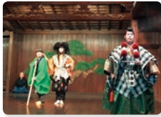
〈舞台芸術科〉 杉並能楽堂での卒業公演