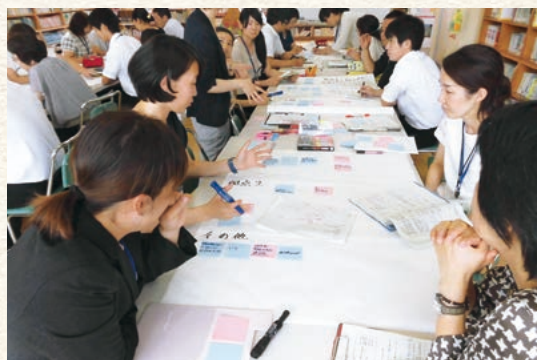
国語科の校内研修で、研究協議の視点を定め、ワークショップ型のグループ協議を行う教職員