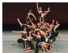
芸術性の高いダンス部の演技

芸術系文化部の活躍は目覚ましく、右記の顕著な実績だけでなく、国際大会や国際コンクールで活躍する生徒を輩出しています。