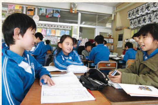
3年生の国語科「モチモチの木」の授業で、グループごとに意見を共有して、考えを深める児童

本県教育の振興に寄与することを基本理念の一つとして、様々な事業を展開している当支部ですが、各学校が他校の教育実践をリスペクトし活用して、自校の子どもたちのための課題解決を図ろうとしていることに感激しました。併せて、この事業を通じて、各学校が学び合い高め合って共に向上しようとしている姿勢は、当支部が相互扶助の精神に基づいて、「安心・安全・助け合い」の輪を広げてきたことと軌を一にしていると改めて意を強くしました。