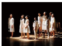
〈演劇部〉 全国高等学校総合文化祭文化庁長官賞受賞