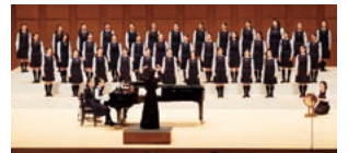
〈音楽科〉定期演奏会

多様な経験と豊富な知識を持ち、第一線で活躍されている著名な講師陣により、極めて専門性の高い授業を展開しています。また、ノーチャイム制のもと、単位制専門高校のメリットである少人数制の授業展開を行い、きめ細やかな指導を受けることができます。さらに、日本画室・油絵室・デッサン室・音楽レッスン室(グランドピアノ34台)・ソルフェージュ室・CG室・専用スタジオ・舞台レッスン室・舞台総合練習場など、恵まれた施設設備の環境で生き生きと学んでいます。