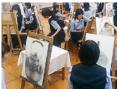
〈美術科〉恒例のデッサン「やかんコンクール」

外部模試と学習状況のデータ管理システムを導入し、生徒のニーズや進路希望に応える体制を整えています。また、生徒は芸術系大学の実技試験対策に加えて、進学に向けた講習などの共通教科の補習授業に取り組んでいます。東京芸術大学・筑波大学・東京学芸大学・埼玉大学・国際基督教大学・立教大学・日本大学(芸術学部)・多摩美術大学・武蔵野美術大学・女子美術大学・国立音楽大学・武蔵野音楽大学・日本女子体育大学などの進路実績(過去3年間)があります。