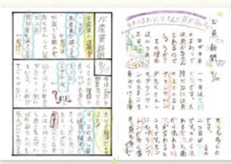
実際に子どもたちが書いたはがき新聞

学んで分かったことをそのままにするのではなく、自分の言葉でまとめ直して発信することを大切にしています。そこで私は、「はがき新聞」を活用しています。学習した内容を振り返り、1枚のはがきサイズの新聞に、情報を取捨選択して重要なポイントをまとめます。単元のまとめでは、自分には何ができるかを考え、表現するためのツールとしても活用しています。また、廊下に掲示するため、読んでくれる人がいるという意識をもって書くことができています。