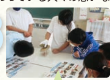
かつおぶし教室での削り体験の様子

験、かつおぶしが作られる際の工夫や関わっている人々の思いなどを聞きました。学習内容の理解が深まっただけでなく、新たな疑問や調べてみたいことが生まれた子どもたちも多かったです。 かつおぶしには、いろいろな人の思いが詰まっていることが分かった。 かつお以外の魚を使った加工品の作り方も知りたいと思った。