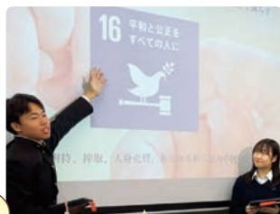
探究ゼミの成果発表

最初は何をしたら良いかわからず苦労しました。今は自分から発言し、意見交換などができています。