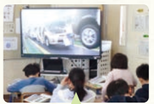
メモを取りながら動画を視聴している様子

子どもたちが実感を伴いながら学習することができるよう、2つの「体験」を多く取り入れることを意識しています。1つ目の「体験」は、写真を見たり動画を視聴したりする間接体験です。特に、動画を視聴することで写真だけでは分からなかった新たな気づきが生まれています。2つ目の「体験」は、実際に自分で体験する直接体験です。最近、「にんべん」から講師の方をお招きし、かつおぶし教室を開催しました。かつおぶしの削り体