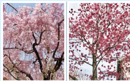
「ヤエベニシダレ」 記念樹 「ヨウコウ」

今回紹介させていただく学校は、浦和の仲本小学校です。設立90年以上ある伝統的な小学校で、学校のシンボルは桜と太鼓です。桜は、設立50周年から卒業生が毎年記念樹として植樹しており、春には色々な桜が咲き、とても綺麗です。太鼓もイベントの時には使用しているそうで、卒業・入学シーズンには、太鼓のまわりに桜を飾り、華やかに演出するなどしています。そんな学校ですが、文教のまち浦和らしくと