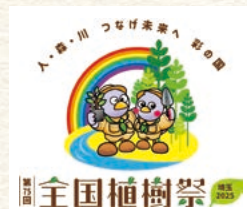
第75回全国植樹祭埼玉県実行委員会許諾第16号

来年、当支部は創設70周年の節目を迎えます。引き続き「最終受益者は子どもたち」という理念のもと、本県教育の振興と教職員の福祉向上に向け、少しでも皆様方のお役に立てるように諸事業に取り組んでいく所存であります。そのことで全国植樹祭のテーマやねらいと同じく、未来や次の世代に繋げるように、皆様方とともに大きく飛躍してまいります。本年もよろしくご指導及びご協力をお願い申し上げます。