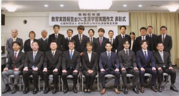
教育実践報告受賞者と審査委員

当支部では、教職員が実践している日ごろの教育活動や研究の成果をまとめ、発表する機会として「教育実践報告」を募集しております。また、県内在住者、在勤者を対象にテーマを設けて、日々の暮らしの中で実践していることを発表する機会として「生涯学習実践作文」を募集しております。たくさんのご応募をいただき大変ありがとうございました。なお、これらの実践は、それぞれ「教育実践報告集56」、「生涯学習実践作文集35」に掲載し、令和7年4月に刊行の後、5月以降にジブラルタ生命のLCが、各学校にお届けいたします。