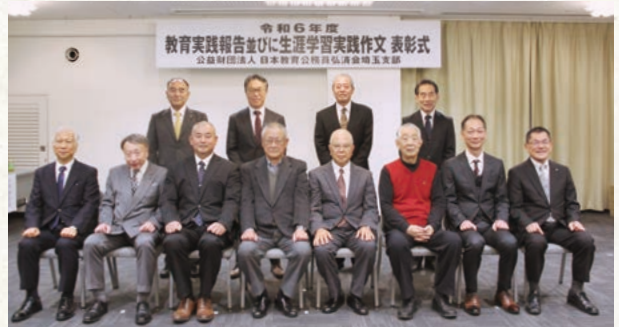
生涯学習実践作文受賞者と審査委員