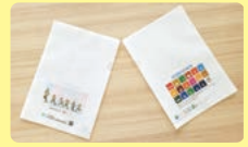
オリジナルペーパーフォルダ

応募者全員に「応募ありがとう賞」として、オリジナルペーパーフォルダ3枚をジブラルタ生命のLCがお届けしています。 皆さまのお手元にはもう届きましたか？まだ受け取られていない方は、大変お手数ですが、ジブラルタ生命のLCにお問い合わせください。