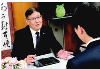
全校生徒1,000人以上との校長面接

校長先生との面接は緊張しますが、いろいろなアドバイスをもらえるので、とても良い経験になります。