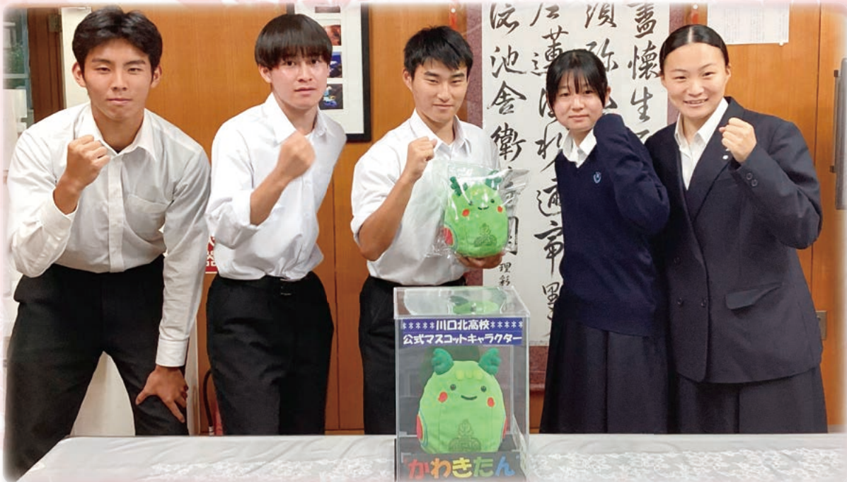
創立50周年を記念して生徒のアイデアから誕生した公式マスコットキャラクター”かわきたん”とともに 埼玉県立川口北高等学校 (本文p.3)