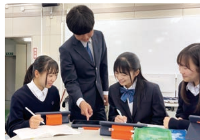
生徒同士での学び合い

1,2年生では文系・理系に分けずに、全ての科目に取り組みます。3年生では、文系・理系に加えて「文理融合系」を新設。最先端のデータサイエンスや英語論文(探究)などの学校設定科目を学び、国公立大学進学や総合型選抜への対応など、自らの可能性を最大限に引き出すための選択ができます。