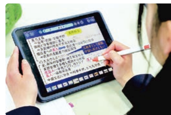
タブレット(iPad)は必須アイテム

先生も生徒もiPadを持っていて、授業、発表、連絡ツール等でとても便利です。ノートとして使ったり、小テストや意見交換でも活用できるので学習活動がとてもスムーズです。